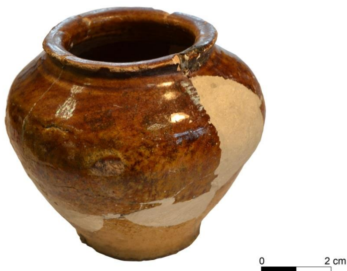
Ryc. 3. Zrekonstruowane naczynie gliniane, w którym znajdowały się monety.

W pracowni konserwacji ostrowieckiego muzeum wykonano rekonstrukcję naczynia na bazie pozyskanych fragmentów ceramiki 3 . Posiada ono wysokość 6,5 cm, maksymalną średnicę ok. 7,5 cm i wykonane jest z białej gliny. Cała powierzchnia wewnętrzna i znaczna część zewnętrznej, bez partii przydennej i dna, pokryta jest żółto-brązową polewą. Pod wylewem przebiega delikatnie zaznaczony ciemniejszy, wąski pasek (ryc. 3).