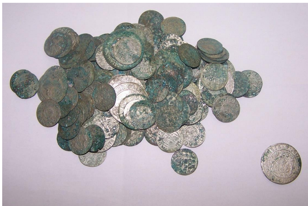
Ryc. 2. 180 monet ze skarbu w dniu odkrycia.

W ciągu dwóch kolejnych dni, po wcześniejszym zgłoszeniu znaleziska do Wojewódzkiego Urzędu Ochrony Zabytków w Kielcach i uzgodnieniu dalszej procedury postępowania, rozpoczęły się prace weryfikacyjne w miejscu gdzie dokonano odkrycia 2 . Pierwszym krokiem było sprawdzenie miejsca znalezienia skarbu detektorem metalu oraz zebranie luźnej ziemi zalegającej w promieniu kilku metrów od punktu wskazanego przez odkrywców. Została ona w całości przesiana przez sita. Następnie na odcinku ok. 4 m wybierano warstwami zasypisko rowu instalacyjnego, także je przesiewając. Zasypisko wybrano do głębokości ok. 1 m osiągając nienaruszone przez koparkę warstwy gruntu. W wyniku tych działań udało się odnaleźć jeszcze 6 monet oraz kilkanaście części naczynia, w którym skarb był zdeponowany. Znalezione fragmenty posiadały świeży przełom, a także ślady zielonej patyny na wewnętrznych powierzchniach powstałe w wyniku długotrwałego kontaktu z metalem. Według informacji znalazców, obok rozbitego naczynia widoczne były również fragmenty szarej tkaniny lub skóry, które uległy zniszczeniu. Podczas badań weryfikacyjnych nie odna-