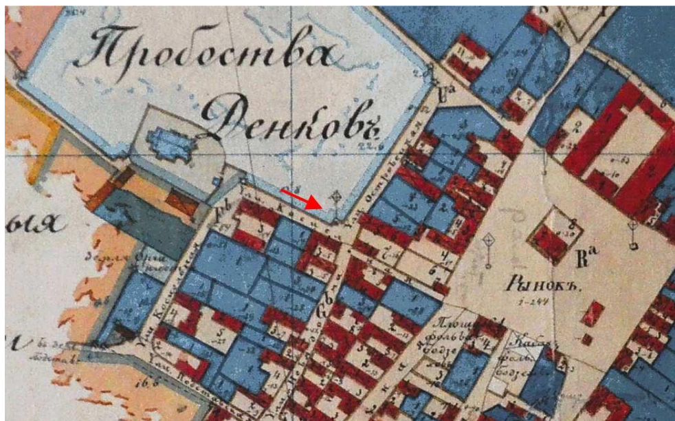
Ryc. 5. Lokalizacja kamiennego krzyża z 1863 r. w pobliżu miejsca odkrycia skarbu na planie Denkowa z 1874 r.

Dlaczego do ich ukrycia wybrano miejsce w centralnej części ówczesnego miasta? Pewną wskazówką, choć siłą rzeczy pozostającą w sferze domysłów jest fakt, że blisko miejsca odkrycia jeszcze w latach 60. XX w. stał kamienny krzyż z 1863 r. fundowany przez rodziny Kaczmarskich i Myśliwskich (ryc. 5) 13 . Być może miejsce to nie było przypadkowe i można domniemywać, że w tej lokalizacji istniała dawna tradycja stawiania krzyży czy świętych figur. Można dopuścić możliwość, że już w pierwszej połowie XVII w. znajdował się w tym rejonie krzyż, zapewne drewniany, który jako charakterystyczny punkt w topografii miasta został wybrany do zdeponowania monet. Praktyka ukrywania kosztowności w pobliżu takich obiektów była zresztą bardzo często stosowana.