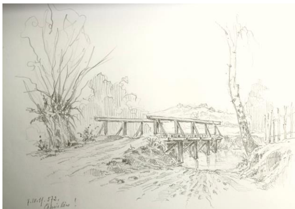
Ryc. 7. Chmielów, rzeka Kamienna.

– I...i, jedynie cicha, duchowa muzyka fortepianu, jest niezmiennie cudownie piękna. Przewspaniała narratorka życia. /!!!!/16.