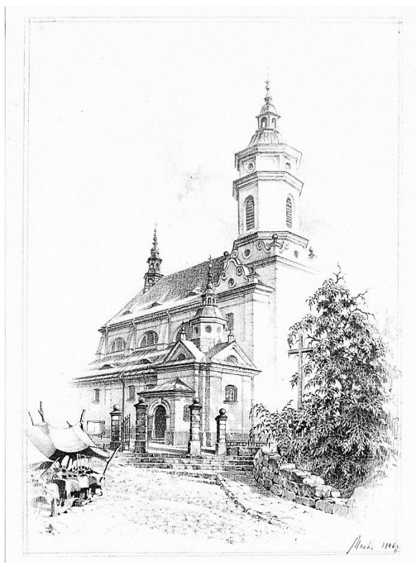
Rys. 8. Kościół pw. św. Michała.

– Pływał sprintersko, w stylu dowolnym, o każdej porze roku, nawet zimą. Był „morsem”, kiedy jeszcze morsowanie nie było takie modne.