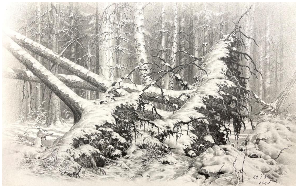
Ryc. 4. Korzenie.

W dorosłość Zygmunta Mruka wprowadza wiersz, gdzie są obecne dojrzałe przemyślenia nad przemijaniem i osiągnięciami życiowymi (a właściwie ich brakiem), jak również z postanowieniem o pisaniu – notowaniu życia.