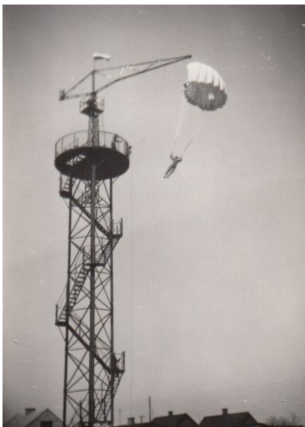
Ryc. 5. Wieża spadochronowa.

Na kartach dzienników przewijają się obrazy miejsc, budynków, których już nie ma, np. wieża spadochronowa na ul. Kopernika.