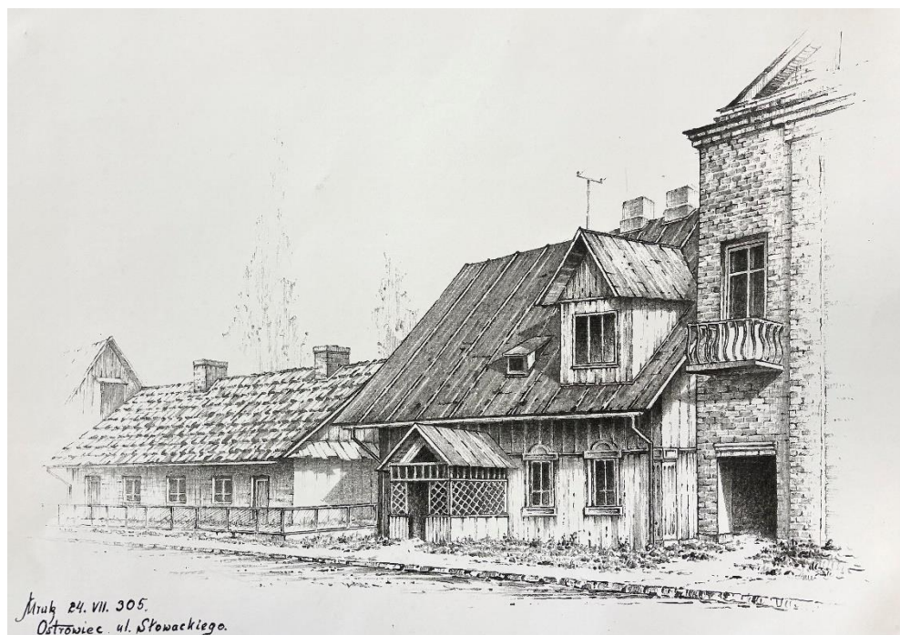
Ryc. 3. Ostrowiec Świętokrzyski – ul. Słowackiego.