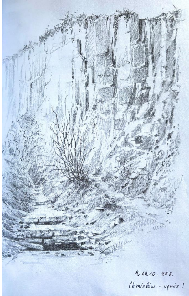
Ryc. 1. Chmielów – kamieniołom.

– To... to z jego pamięcią zaczęły się moje „maje”...!/ Zaczęła się kontemplacyjna, zamyślona wrażeniowo duchowość... Dziwna niepojętność świata z uznojonymi po ciepłym, żniwnym dniu, wieczorami. /Chmielów/. Zapach odurzający maciejki i... szalone loty piszczących radośnie jaskółek. Piękno. /!/ Fantastyczne czucie aż po... zauroczenia! 5