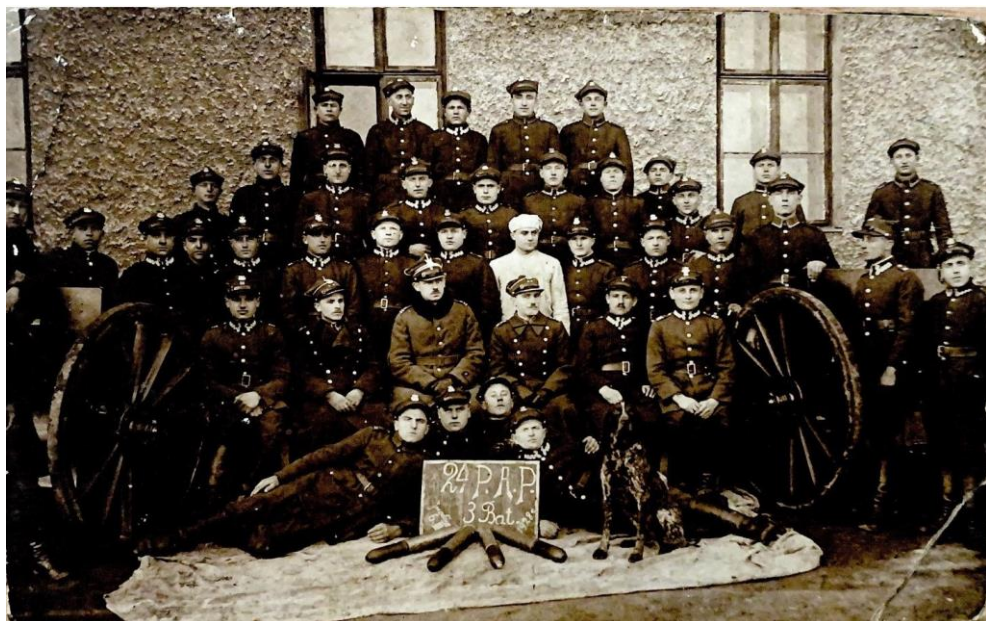
Żołnierze 24 pułku artylerii polowej z Jarosławia wcieleni przez Powiatową Komendę Uzuppełnień Ostrowiec.