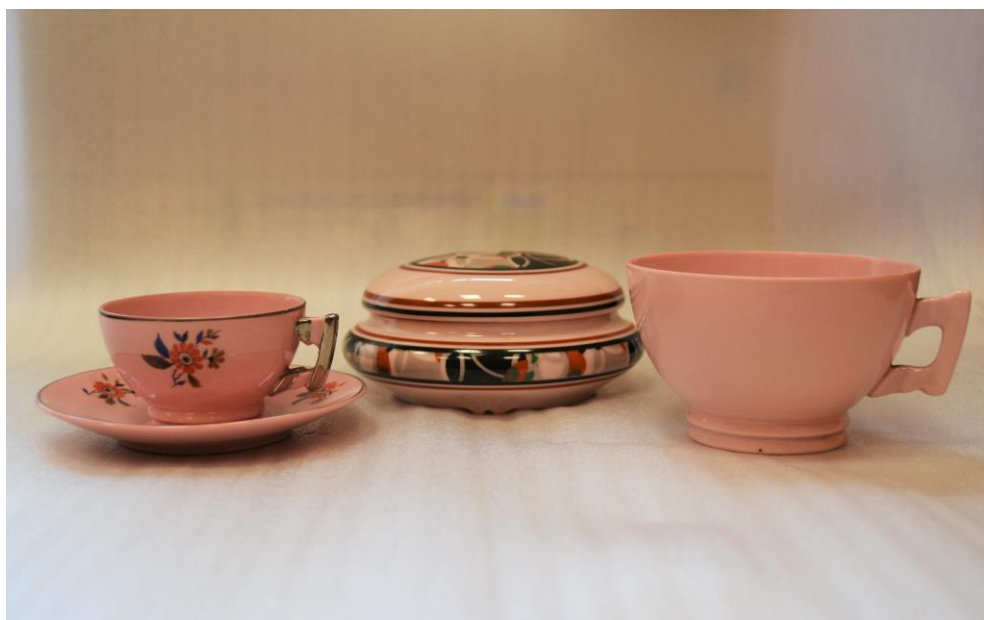
Filiżanka, bombonierka, porcelana różowa, Ćmielów; własność Muzeum Historyczno-Archeologicznego w Ostrowcu Świętokrzyskim.