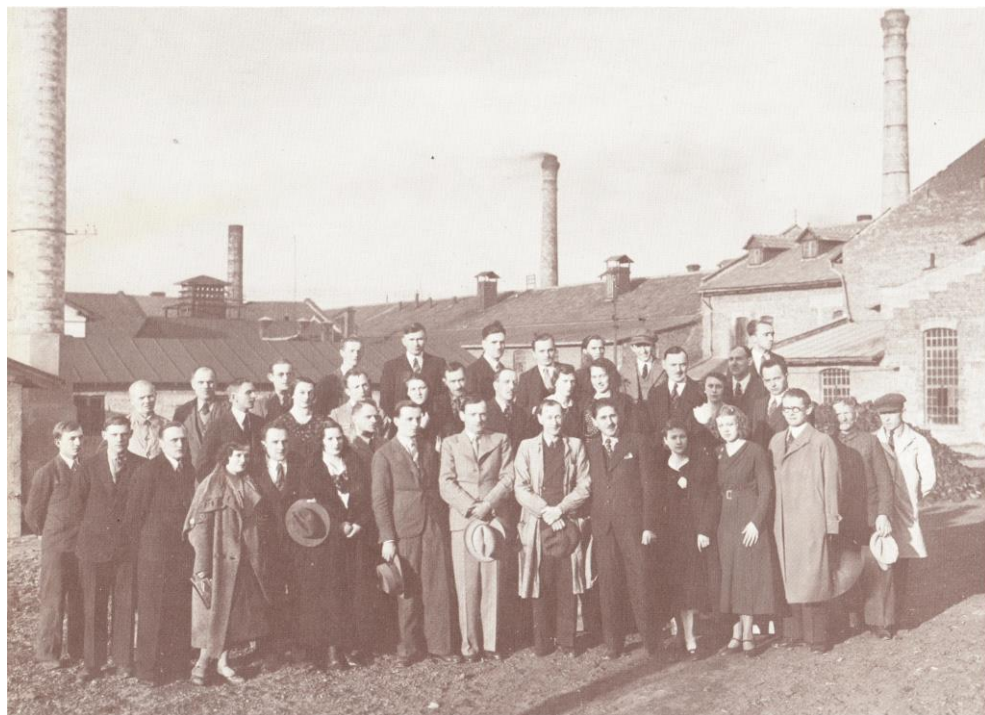
Pracownicy Fabryki Porcelany i Wyrobów Ceramicznych Ćmielów. S.A., na tle zakładu, 1935 rok [w:] B. Kołodziejowa, Z. Stadnicki, Zakłady Porcelany Ćmielów , Kraków 1986 rok, fot. 14.

technicznym Spółki a projektantami i modelarzami fabryki istniała doskonała współpraca.